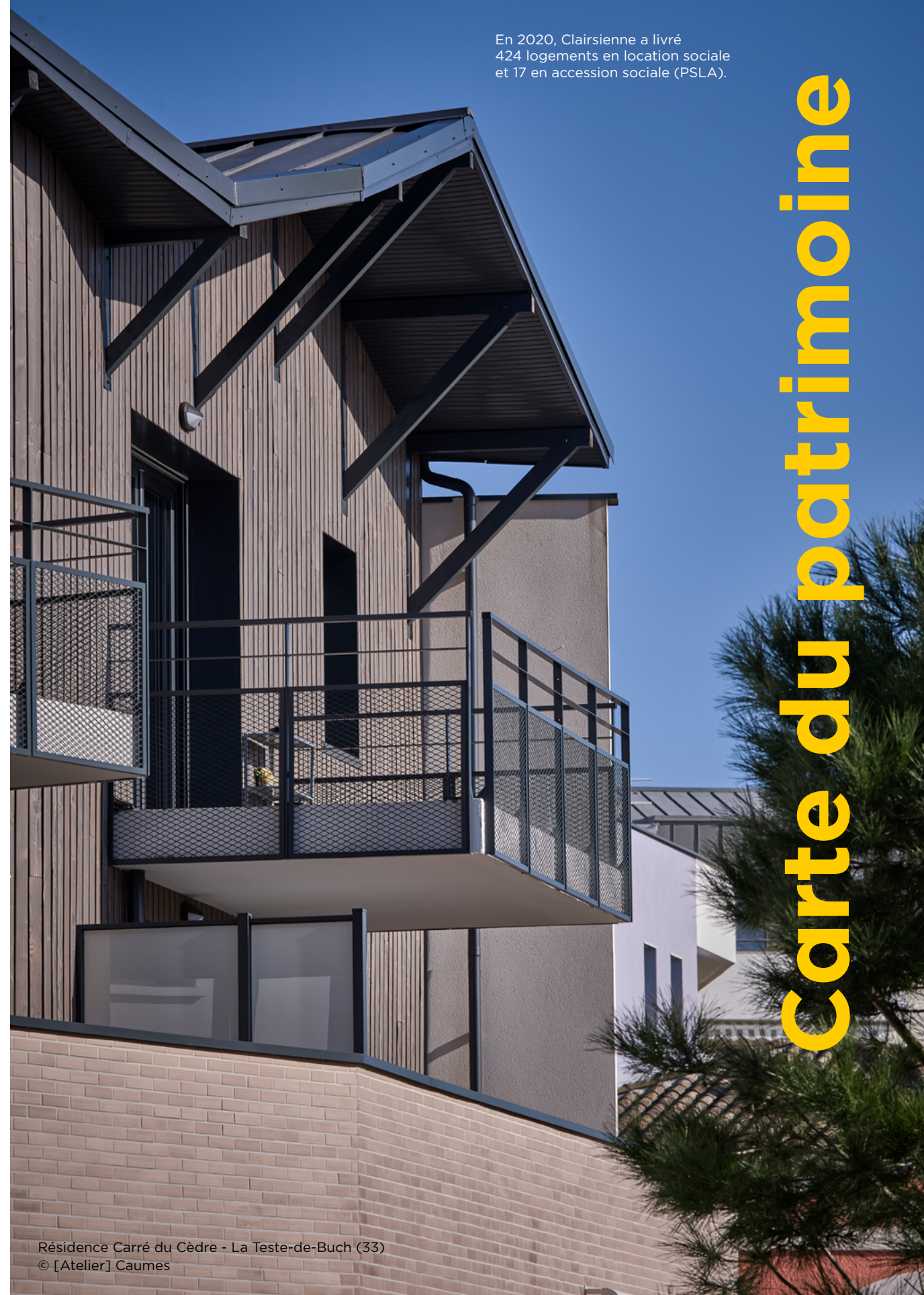
Résidence Carré du Cèdre - La Teste-de-Buch (33) © [Atelier] Caumes