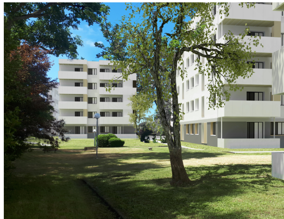
Résidence L'Ermitage Gradignan (33) 80 logements © Architecte Alexandre DUMOULIN

À Bassens , Clairsienne poursuit la réhabilitation des 180 logements de la résidence Beauval, à laquelle s'ajoute la construction de 24 logements en accession sociale et de 30 logements locatifs en attique. En 2020, l'arrêt du chantier lié au 1 er confinement, cumulé aux infiltrations répétées induites par les surélévations, a conduit les locataires et les équipes vers une situation de crise. Fort de ce constat, Clairsienne a donc totalement repensé la stratégie et la démarche associée à ce chantier avec ses locataires.