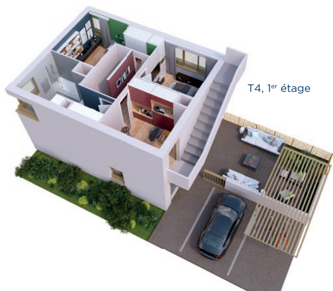
T4, 1 er étage

Ventilation par système flux hygro réglable pour une meilleure régulation de l'air