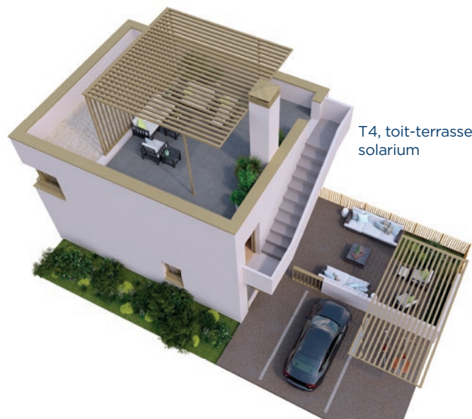
T4, toit-terrace solarium